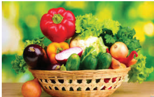
Gambar 3. Bahan Makanan yang mengandung antioksidan.