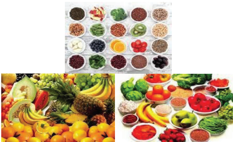
Gambar 4. Makanan halal, baik, sehat, seimbang dan beragam.

Tidak ada satupun bahan pangan sempurna yang dapat menyediakan semua unsur nutrisi yang dibutuhkan oleh setiap individu. 21 Karena itulah, memilih makanan untuk dikonsumsi sehari-hari, sebaiknya sesuai dengan perintah dan larangan al-Qur'an dan anjuran Nabi Muhammad saw, seperti yang telah dijelaskan penulis di atas. Selain itu hasil riset ahli gizi menunjukkan makanan yang baik dan seimbang tidaklah cukup, diperlukan beragam makanan.