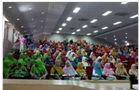
Suasana Kursus Muballighat

Dengan adanya berbagai kegiatan yang dilakukan oleh Aisiyah ranting Kassi-kassi terutama kegiatan gerakan jamaah dan dakwah, berarti ikut berkontribusi kepada negara untuk mengajarkan hidup aman, nyaman, selamat dan tenang serta menjauhkan diri dari kebodohan, memiliki ethos dan semangat dalam memajukan kesejahteraan umum,