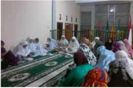
Suasana Gerakan Pengajian