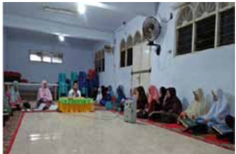
Kegiatan sosial, ekonomi dan kesehatan