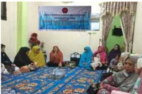
Suasana Gerakan Pengajian