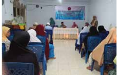
Kegiatan sosial, ekonomi dan kesehatan