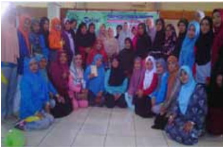
Suasana Gerakan Jamaah dan Dakwah